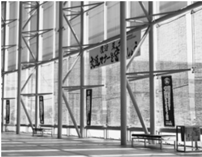
庁舎1階町民ホールに設置されたよしず

答 本町では8事業所に相談支援事業を委託し、障がいのある人や家族からの相談に相談支援専門員が情報提供、アドバイス等の支援を行っている。 災害時の支援については障がいのある人が迅速・安全に避難できるよう災害時要援護者支援対策マニュアルを見直す中で、福祉避難所を増やせるよう努めた