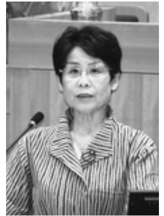
西岡 恵子 議員

答 町内4小学校では、地域と連携した環境学習や阿波踊り学習、藍文化体験学習、人参栽培及び収穫体験学習などの継続的な活動が評価されて今回の推薦となった。