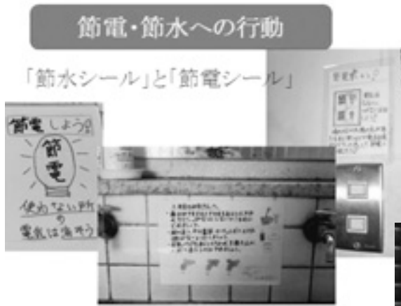
節電・節水への取組（藍住北小学校）

が電気消耗灯と水の無駄遣いを呼びかけたり、各所に節電エコシールや節水シールをはる、エコチェックカードの配付など節電・節水意識を高めている。