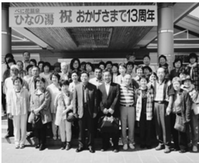
町民号、河北町を訪問 (石川町長、江西議長、参加された藍住町のみなさん)

昨年、友好都市締結20周年を迎えたことから、8月4日に河北町で、河北町、石巻市、藍住町による記念式典を行い、三者による災害応援協定の締結を予定している。 また、6月28日からは「友好都市21周年記念口マンのかけはし・町民号」による河北町への訪問、藍住町納涼祭では河北町の「冷たい肉そば」の販売、9月のスポーツ少年団交流、10月には、河北町から議会議員の皆様が、11月には「友好の翼町民号」の来町も計画されている。 こうした事業により、更なる友好交流を深めてまいりたい。