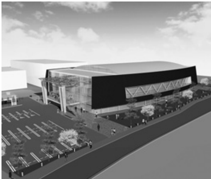
新町民体育館の外観イメージ

答 管理・運営方法やあいずみスポーツクラブとの連携については現時点では未定。 トレーニング室、体力測定室、健康相談室等を受け、幅広い年齢層に対応できる生涯スポーツの拠点として整備したい。