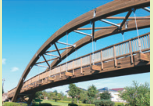
みどり橋 (正法寺川)

月日の流れは早いもので、沖縄県宮古島から藍住町に移り住んで、今年で41年になる。考えてみれば、私の人生の大半はこの町にあったんだと、思いつつ気がついてみれば、島の言葉も暮らしも、何もかも忘れて、まるで唄を忘れたカナリヤのように、さ迷う自分がいたのだ。そんな私が、いつのまにか、阿波弁を使い、何の躊躇いもなく、道を歩いている。それもそのはず、言葉も食の味も、この町の隅々まで行きわたったかのように、まるでこの町に生まれ育ったかのように、日々の暮らしに、根っからの「藍住町人」となりきっているのだ。こんな風に何気なく生きてこられたのは、さもあらん、そばにいる妻のおかげであり、この町の人々が持つ暖かい心と、「共助心」のおかげだと感謝している。ここ数年。藍住町は多くのボランティア活動や、国際交流、子育て支援等。各地域毎の交流も盛んに行われるようになり、町民相互の繋がりも良くなってきた。これは町民一人一人が「共生・相互扶助」そして、強い「共助心」を持つようになったと言う事であろう。これからも、私のように県、町内外からの移住者や、多くの人々に愛され、親しみのある藍住町であってほしいと願っている。