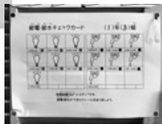
エコチェックカード

が電気消耗灯と水の無駄遣いを呼びかけたり、各所に節電エコシールや節水シールをはる、エコチェックカードの配付など節電・節水意識を高めている。