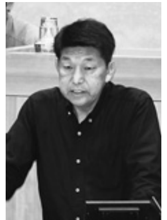
濱 眞吉 議員

答 現行の学習指導要領では従来以上に言語活動、理数教育、伝統や文化に対する教育、道徳教育、体験活動、外国語活動などを充実させることが盛り込まれており、本町では、分かりやすい授業の実践や家庭学習の習慣化などを通じた児童・生徒の一層の学力向上に向けて努力を継続している。