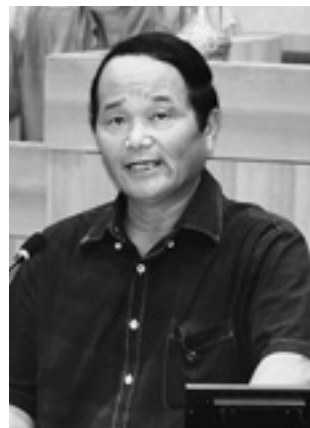
小川 幸英 議員

答 ①現在94組織が結成されているが活動が休止状態のところも多いと思われる。毎年、駐在員会や防災講座で再編や結成のお願い、結成時や活動に対する町からの支援について説明しており、昨年は旧組織を再編された地区や組織設立の問い合わせもあった。 ②自治会等の協力や理解が必要であり、防災対策の一つとして案内してまいりたい。