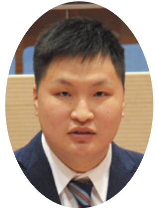
まえ だ あきら 議員 前田 晃良