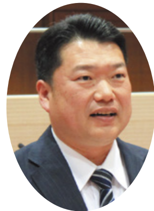
栗島 和義 議員