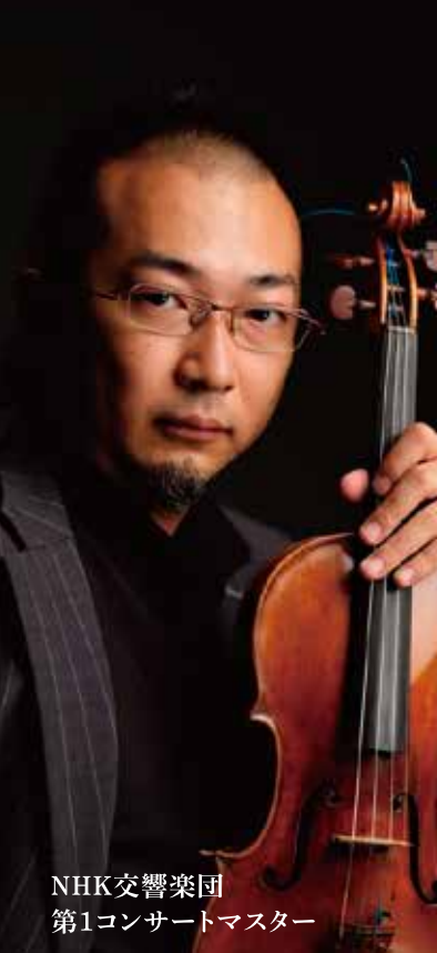
NHK交響楽団 第1コンサートマスター