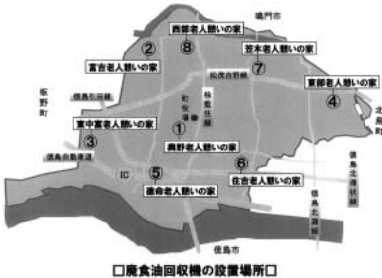
□廃食油回収機の設置場所口

Green Fund AIZUMIとはポイントカード制のサービスを実施しているAZショッピンググループのお店で商品を購入して頂いた時に付加されるポイントの一部を寄付してもらい、これを原資として「廃食油回収機」を町内に設置し、環境保全活動を支援するシステムです。