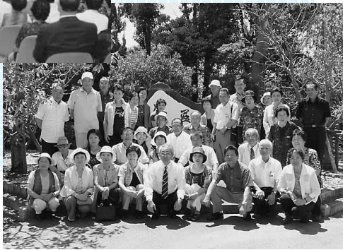
友好の碑の前で記念撮影

見学しました。藍染めは初めて体験する方が多く、ハンカチを思い思いの柄に染め上げ、大変喜んでいました。この日、鳴門市の一番礼所霊山寺や徳島市の阿波踊り観光なども楽しみ、16日に帰途につきました。