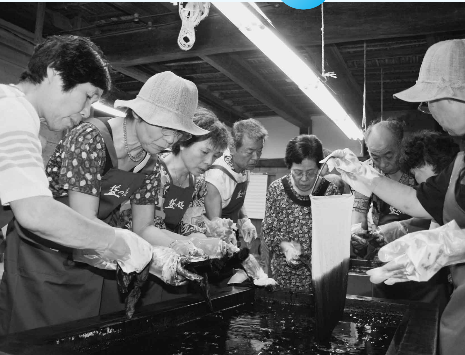
藍の館で藍染め体験をする、友好都市・山形県河北町民号の皆さん（関連記事P7）