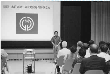
町民シアターでの歓迎式