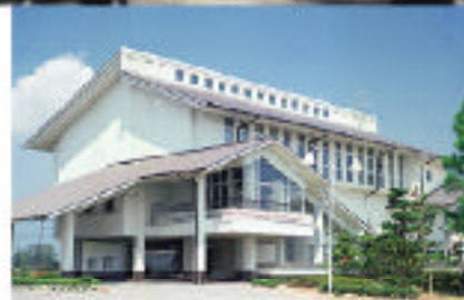
S54.6 女性センター完成