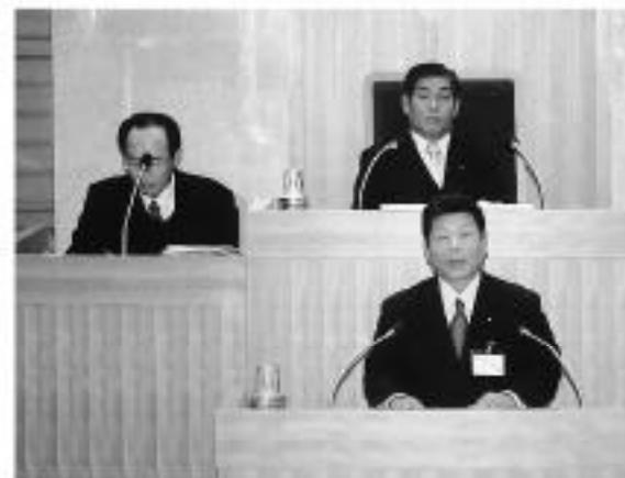
平成17年第1回議会定例会は平成17年3月8日に開会し、町長提案の平成17年度一般会計予算を含む36議案を原案どおり可決、25日に閉会いたしました。