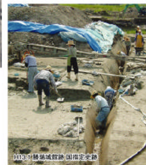
S113.1 勝瑞城跡 国指定史跡