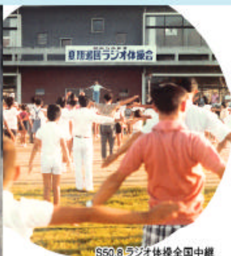
S50.8 ラジオ体操全国中継