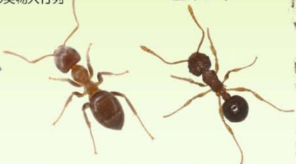
トビロケアリ （約8倍）