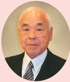
瑞宝単光章 (鉄道業務功労)

昭和46年に教員として鳴門工業高校に赴任。電子工学が専門で、主に工業高校で教鞭をとられました。阿南工業高校長を勤めた後、平成16年度から退職される18年度までの間、徳島東工業高校長として、徳島科学技術高校の設立に尽力されるなど、教育行政の発展に貢献されました。