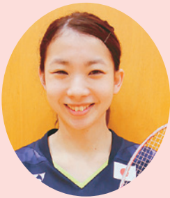
紫綬褒章 (スポーツ振興功績)

昭和49年に海上自衛隊に入隊。以降、航空管制官として全国各地の航空部隊、艦艇部隊で勤務され、平成21年に退官。定年前5年間は徳島空港の航空管制官として、後進の育成、空の安全に尽力されました。常に国民の安全を守るという大きな責任感を持ち、自衛隊業務の遂行に大きく貢献されました。