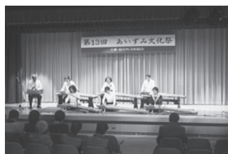
弦の会 藍住支部の演奏

5日は午前10時から開会行事が行われ、西小学校児童による藍栽培についての説明の後、「藍こなしの踊り」が披露され、会場は来場者の大きな拍手に包まれました。