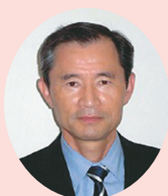
瑞宝単光章 (防衛功労)

昭和38年に徳島県巡査を拝命、主に交通部門において企画運営に努められ、交通安全教育、事故事件捜査、死亡事故抑止対策など、常に県民の安心安全のため、日々精励されました。平成16年に退職されるまでの長きにわたり、自らの危険を顧みず警察業務の遂行に大きく貢献されました。