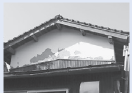
地震により外壁の一部がはがれ落ちている