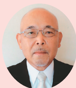
瑞宝双光章 (警察功労)

昭和38年に日本国有鉄道四国支社(現四国旅客鉄道)に入社。県内駅構内の業務のほか、ツアー旅行の企画立案や無人駅の管理など幅広い分野で活躍され、鳴門駅長などを歴任。常に安全・正確・安心を心掛け業務に精励され、平成11年に退職されるまでの長きにわたり鉄道輸送業務の発展に寄与されました。