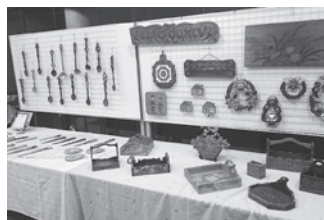
木彫り教室の作品

11月5日、6日の2日間、コミュニティセンターと福祉センターで町文化協会主催による第13回あいずみ文化祭が開催されました。