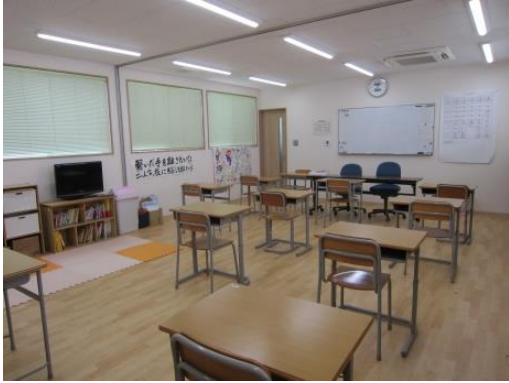
< 大教室 >