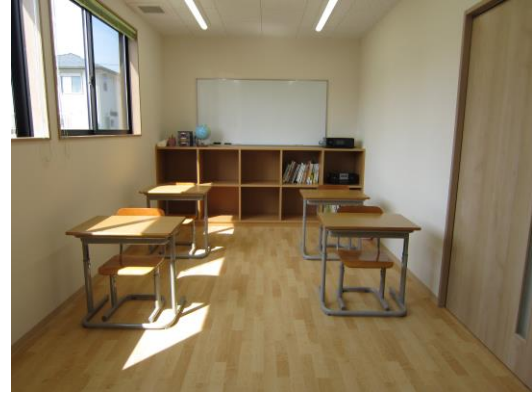
< 小教室 >