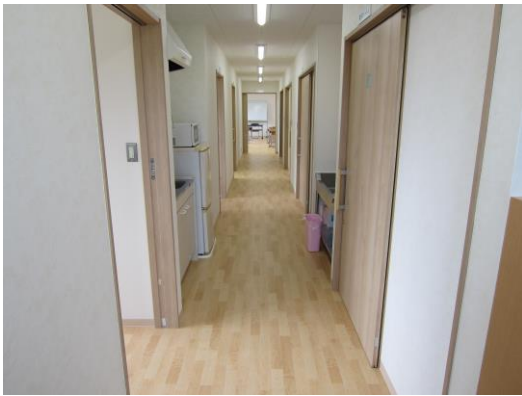
< 廊下 >