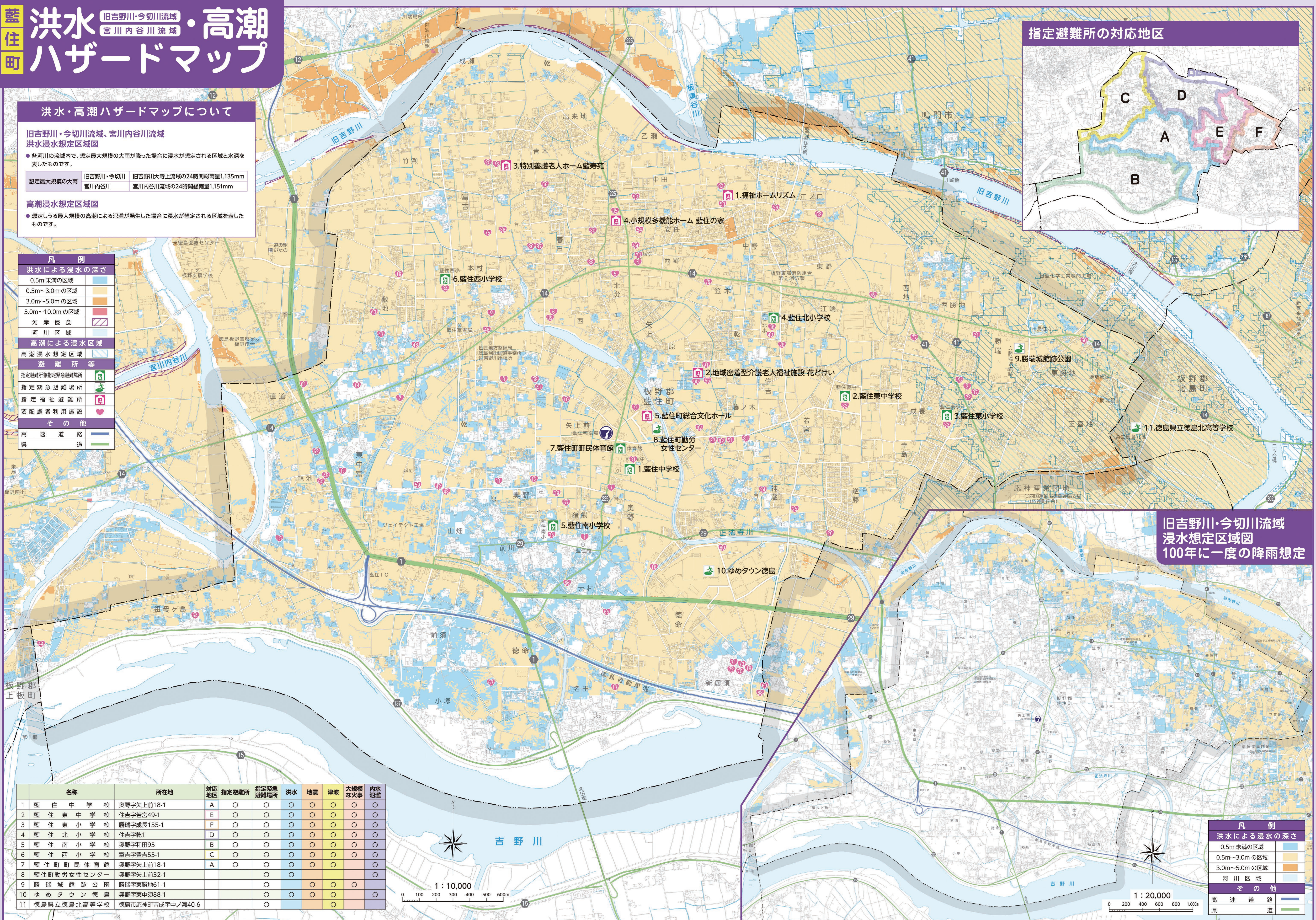
旧吉野川・今切川流域 浸水想定区域図 100年に一度の降雨想定