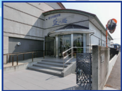
●藍住町歴史館・ 藍の館